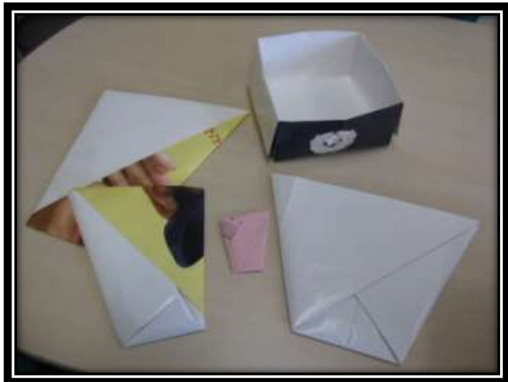
紙の大きささえ変えれば、お皿やコップの大きさも自在です。